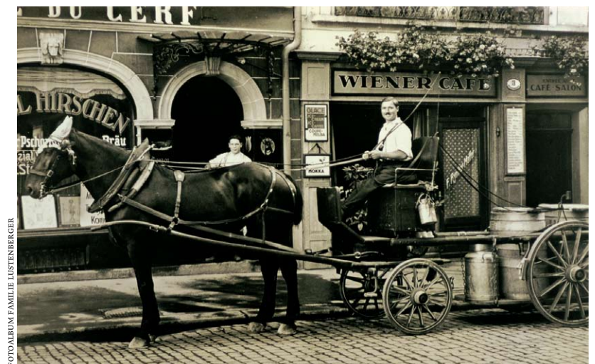
FOTOALBUM FAMILIE LUSTENBERGER