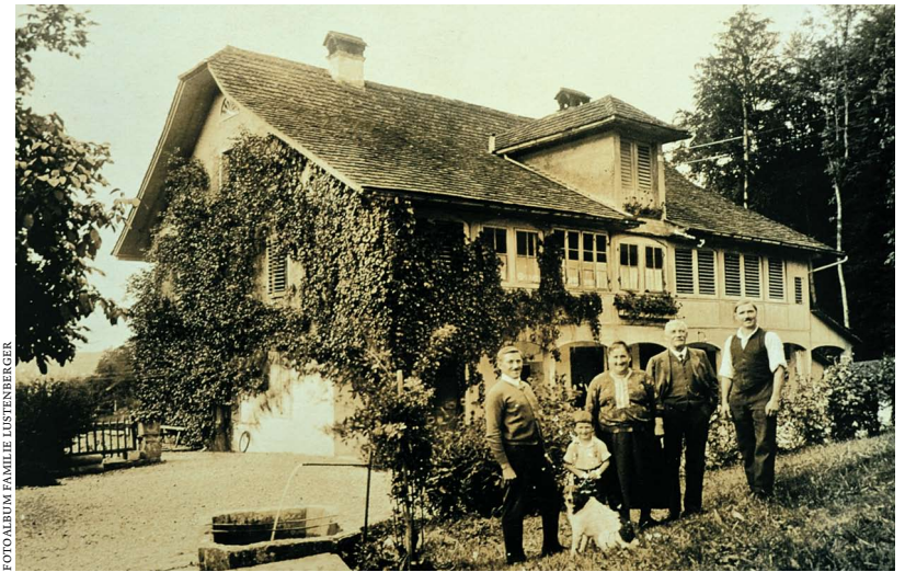
FOTOGALBUM FAMILIE LUSTENBERGER

Nicht nur der Schulweg, auch der Weg zur Kirche war damals weit. Nur während der Kriegsjahre – als die englischen Gäste ausblieben – gab es im Wintergarten des Polytechnikums Gottesdienste. Nach dem Krieg