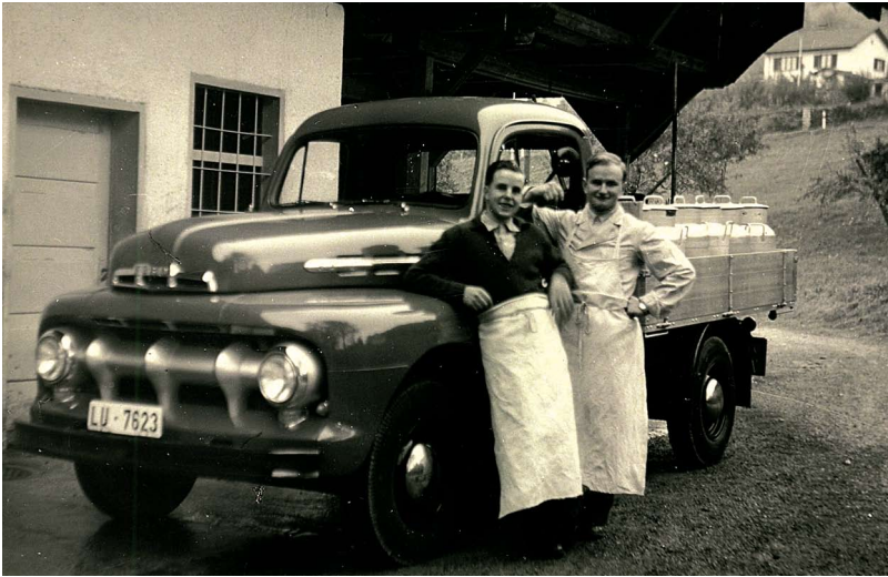
FOTOALBUM FAMILIE WESPI-LUSTENBERGER