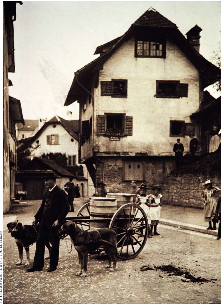
FOTOALBUM FAMILIE WEST-LUSTENBERGER