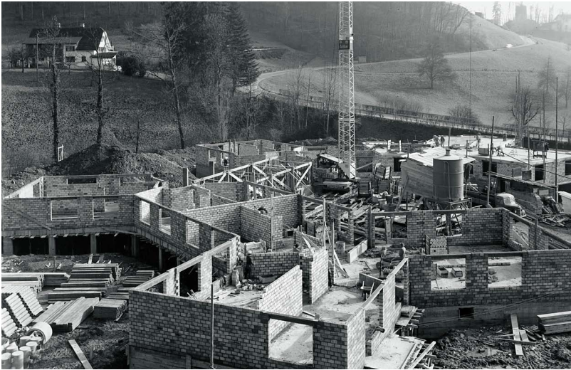
FOTOALBUM FAMILIE WESPI-LUSTENBERGER